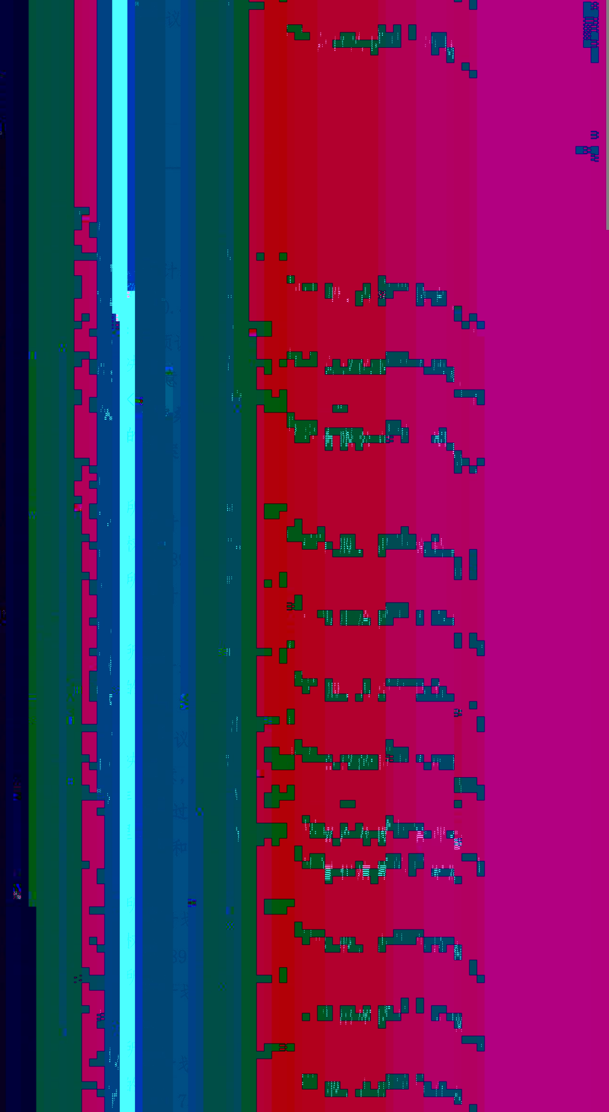
表 议的 的持 本 决权的 3. 审 持 总 会议 的表 持有 人表 议的 持 本 决权的 4. 官 官议 会 总 会议 的表 持有 人表 议的 持 本